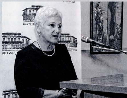
Lietuvos Respublikos Seimo narė Irena Degutienė